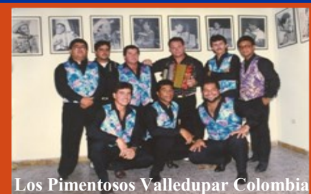
Los Pimentosos Valledupar Colombia